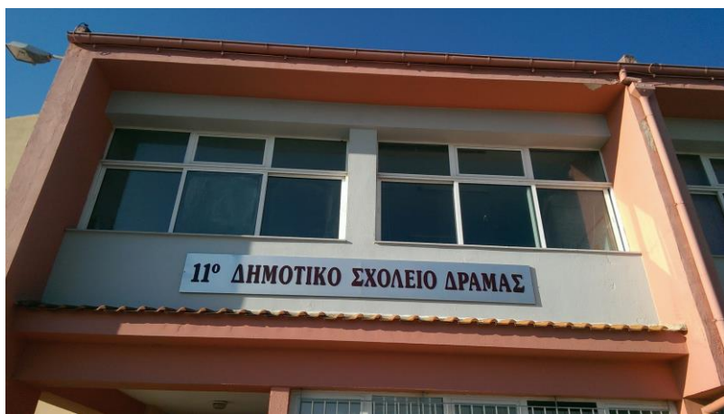
11 ΔΗΜΟΤΙΚΟ ΣΧΟΛΕΙΟ ΔΡΑΜΑΣ